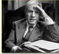
Philip K Hitti